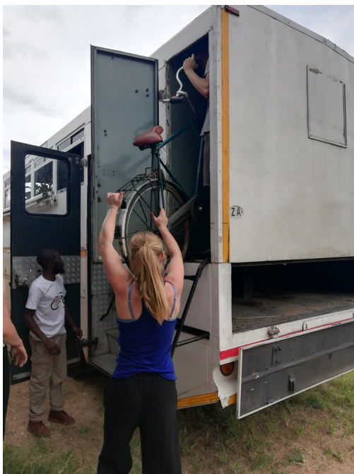
De fietsen 'arriveren' in Chengeta school