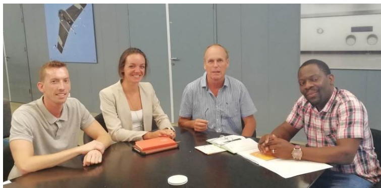
Bezoek aan de Netherlands Bicycle Embassy