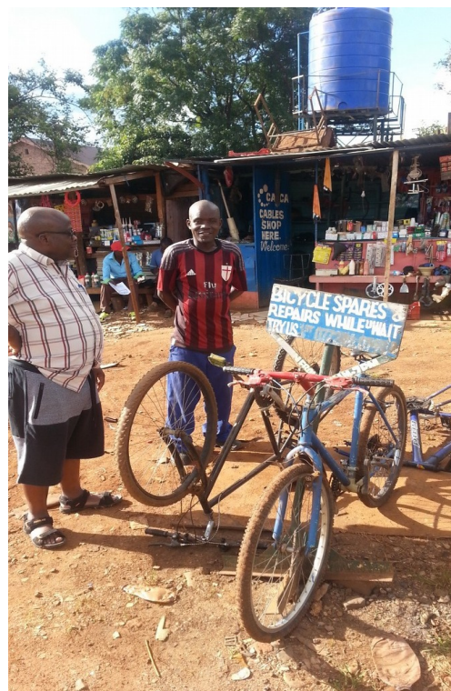
Repair shop in Hatcliff