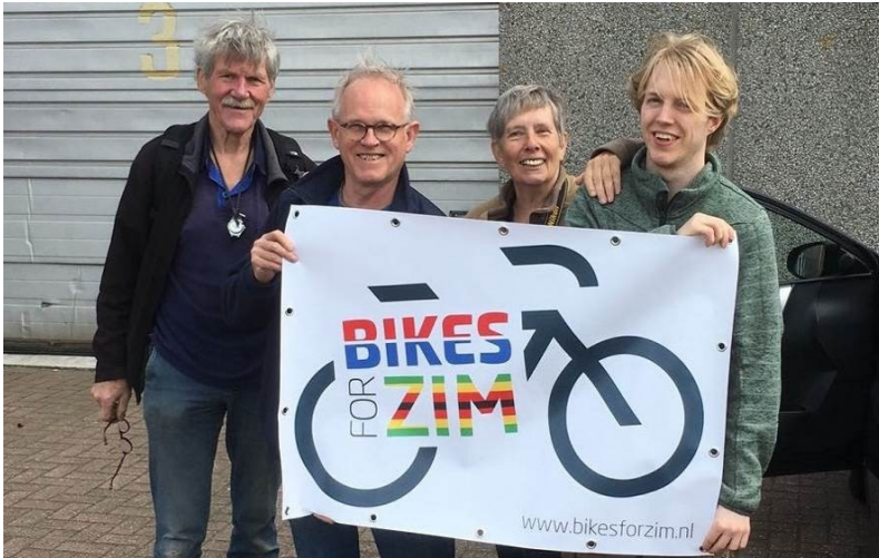
De inpak vrijwilligers / steungroep

Onze bron was TradeFRM de verwerker van de fietsen van het Amsterdamse Fietsdepot.