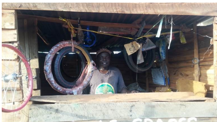
Bicycle parts shop in Hatcliff