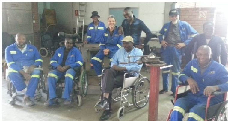
Het RESCU team in hun werkplaats

Meer details zijn te lezen in het jaarrapport van de Bikes for Zim Trust.