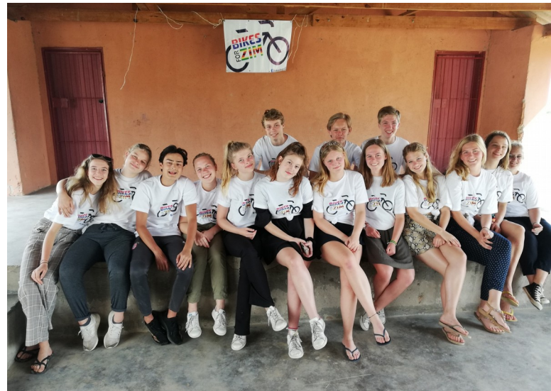
De scholieren die Chengeta steunden