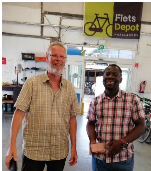
Het Fiets Depot Haaglanden in Den Haag