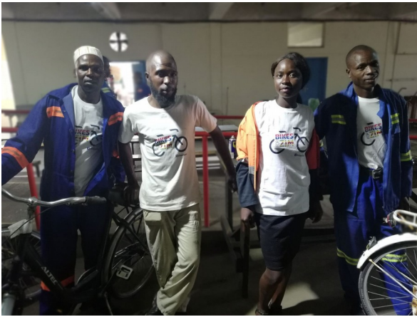
Chichi registreerde elke fiets